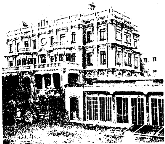
景全館書圖立國天奉